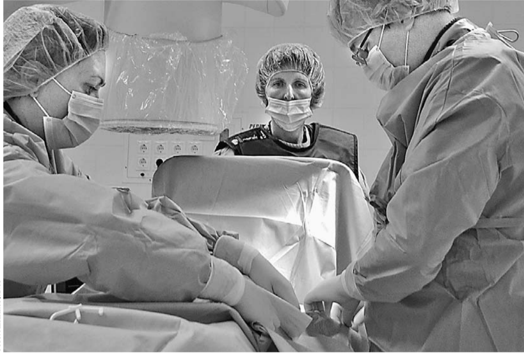
Néhány hete már pacemaker-beültetéseket is végeznek a Hetényi Géza kórházban