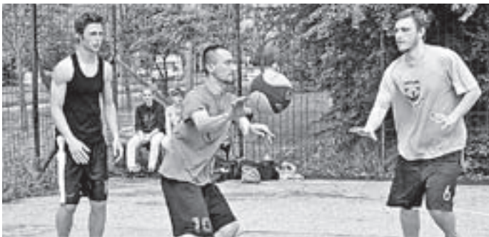
Utcai kosárlabda. Új Nemzedék Streetball Jam néven 4 korosztályban 4 fős vegyes csapatok mérték össze ügyességüket az elmúlt hétvégén a tabáni kosárlabdapályán. A programok között büntető- és hárompontosdobó-versenyeket is tartottak, melyek győztesei értékes ajándékokat nyertek.